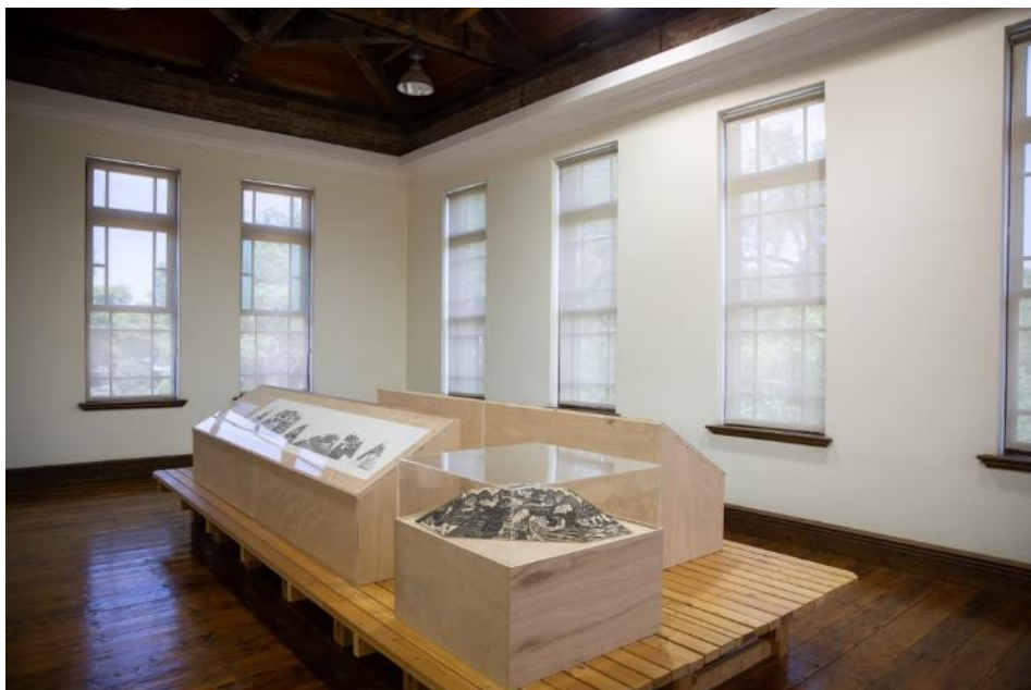
D 展間約 15 坪