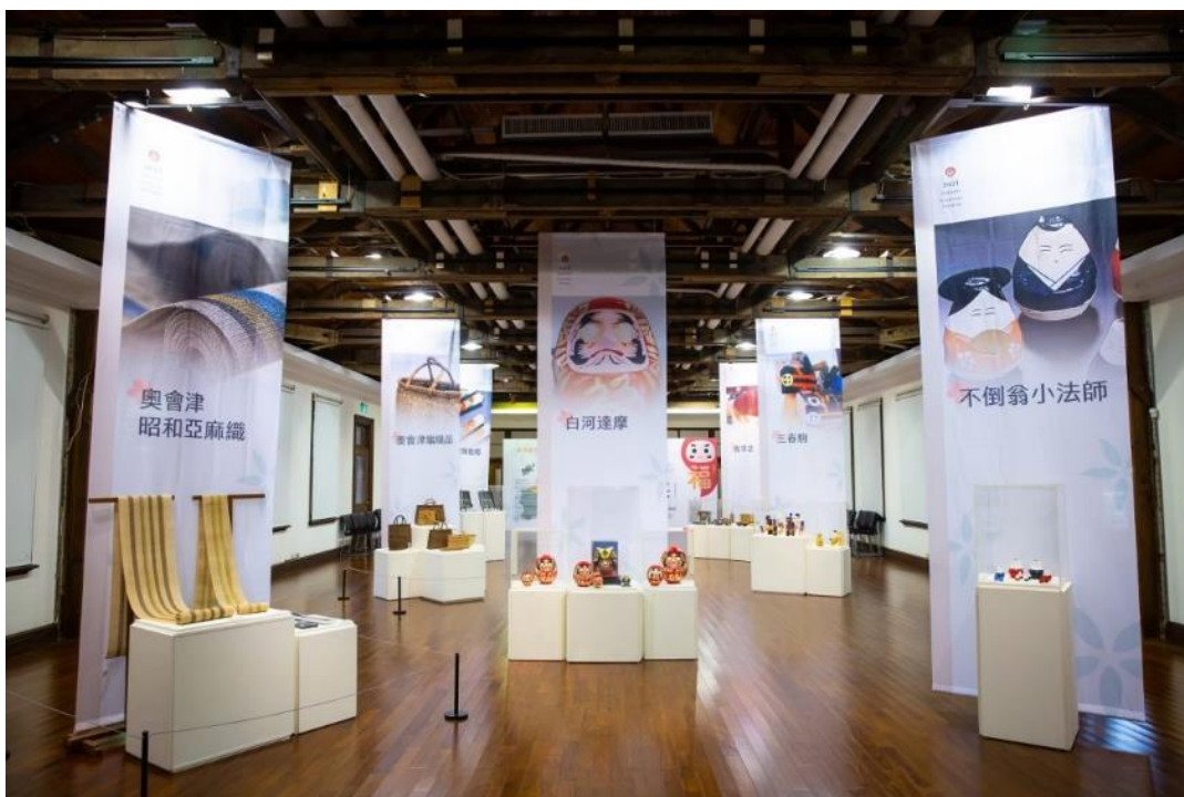
B 展間約 75 坪