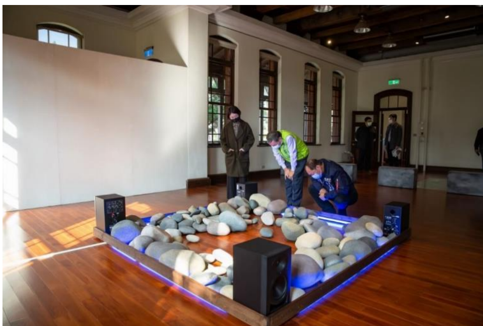
C 展間約 30 坪