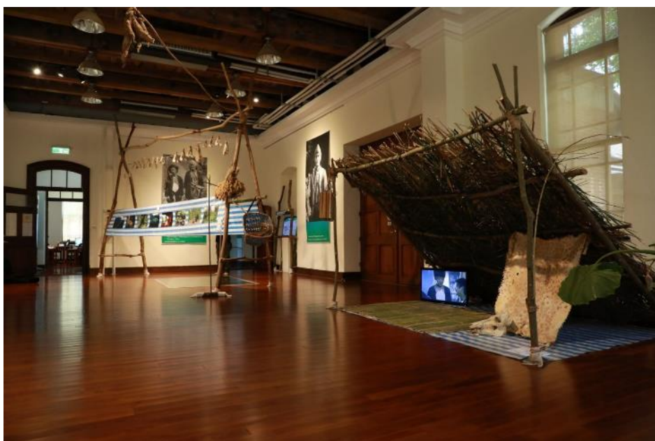
E 展間約 30 坪