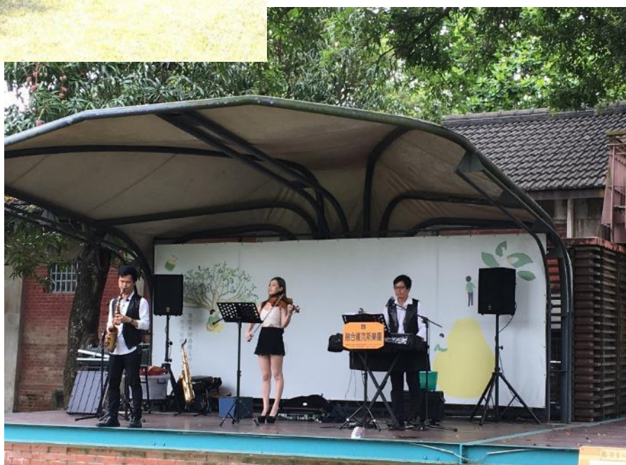
小舞台(戶外演出場地)