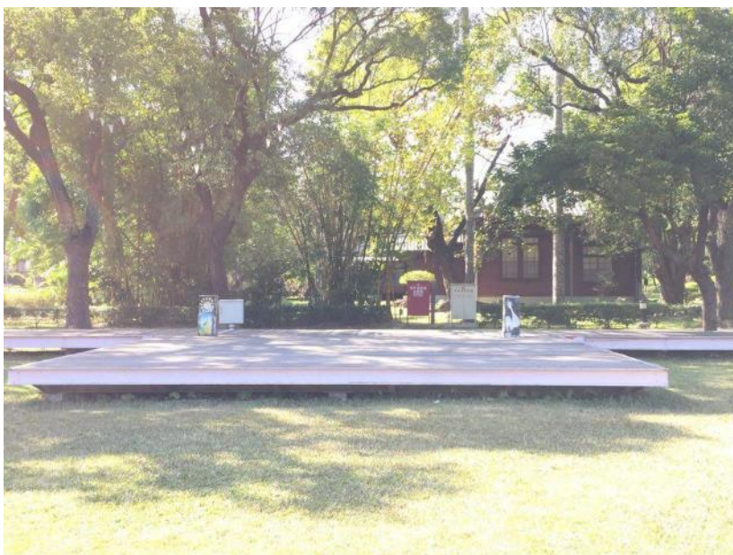
大舞台(戶外演出場地)